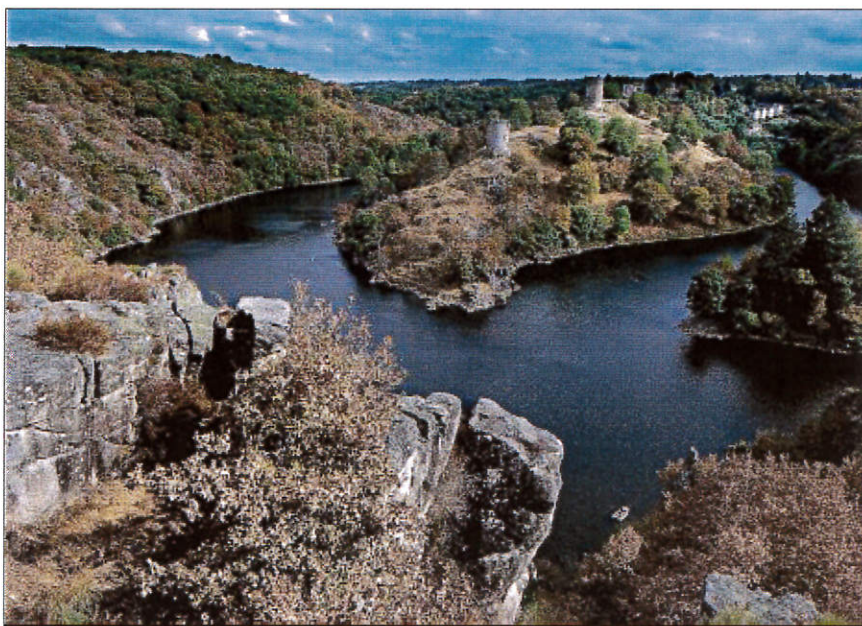
CROZANT. La vallée de la Creuse est depuis le XIX e siècle un lieu d'intense création pour les peintres, les photographes, les intellectuels, qui traduisent la puissance du paysage à travers des œuvres présentées dans le monde entier.

« La charte réaffirme notre partenariat autour d'un objectif commun : la mise en valeur de cette vallée pour son histoire, ses paysages, son environ-