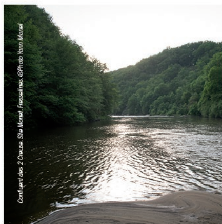
Confluent des 2 Creuse. Site Monet, Fresselines.

A l'issue de son séjour à Fresselines , Claude Monet présente pour la première fois plusieurs toiles d'un même motif : le confluent des 2 Creuse. L'audace est saluée des collectionneurs. Les œuvres acquises sont dispersées dans le monde. En 1889, Monet effectue donc sa première expérience de la série dans la Vallée. Aujourd'hui d'autres peintres s'inspirent des mêmes paysages.